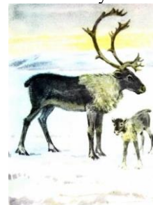
СЕВЕРНЫЙ ОЛЕНЬ У

А потом они вместе отправляются охотиться, и ни ветер, ни снег уже не страшны малышу.