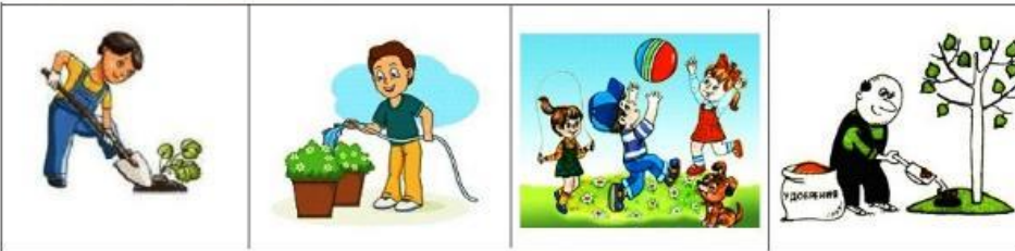
Копать, поливать, играть, удобрять