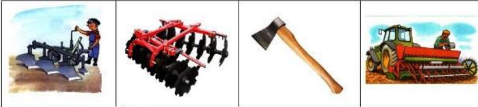
Плуг, борона, топор, сеялка