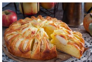
Начинка для пирога (какАЯ)

из яблок - из груш - из бананов - из слив – из абрикосов – из мандаринов - из апельсинов - из винограда -