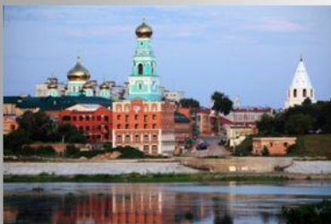
Вид на центральную часть города.