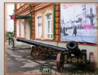
Пушки у входа в краеведческий музей.