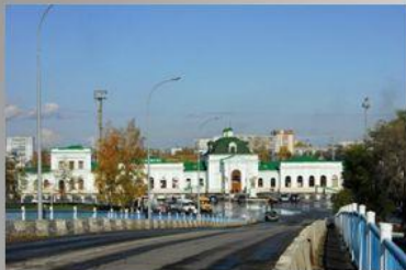
Железнодорожный вокзал – ворота города.