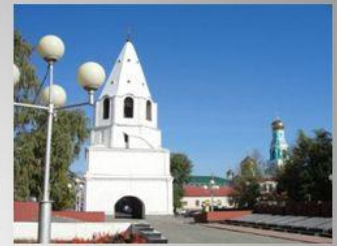
Кремль – исторический центр города.