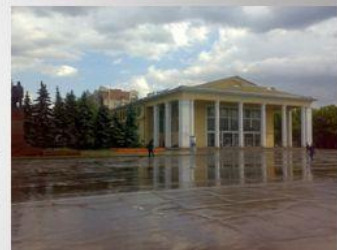
Драматический театр им. Алексея Толстого