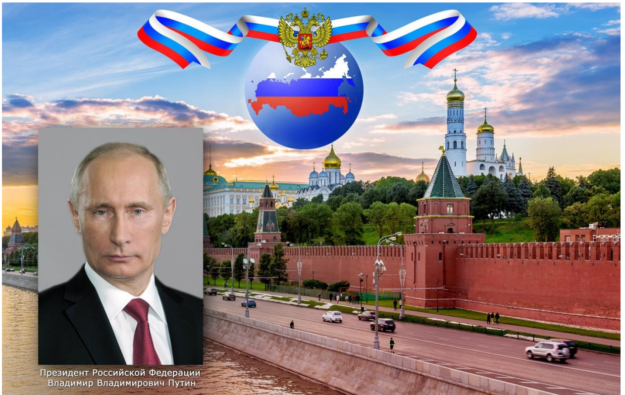
Президент Российской Федерации Владимир Владимирович Путин