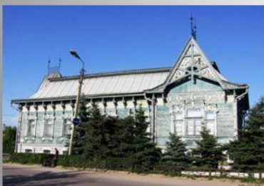
В доме градоначальника Чернухина сейчас Выставочный зал.