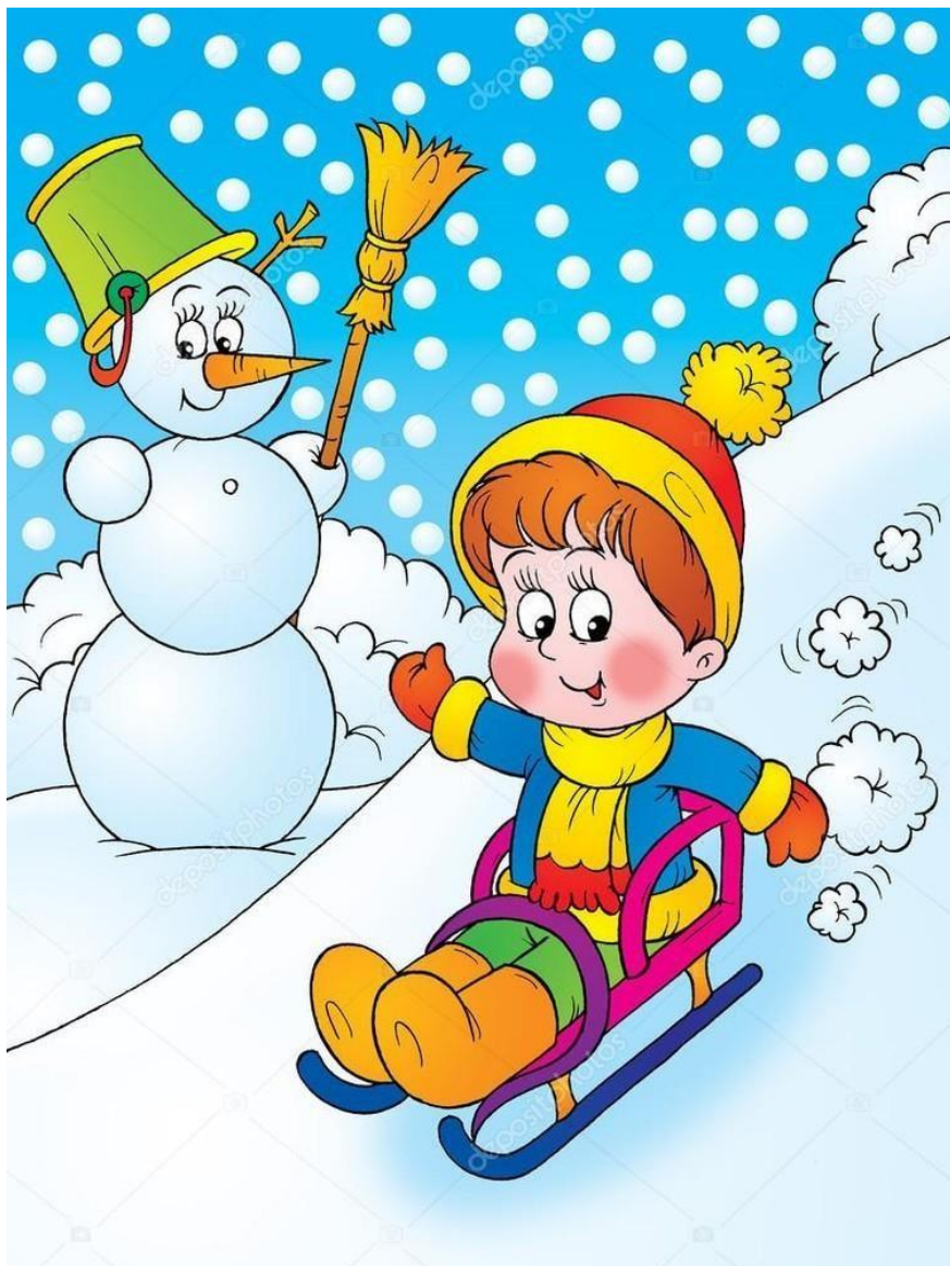
Консультация для родителей "Зима глазами ребёнка"